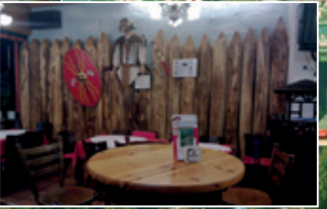
Römischer Legionär mit Palisade und Turm 1 im Gastraum