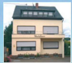
Haus Ännchen Sprudelstr. 42