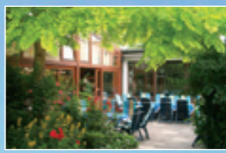
Garten und Terrassenanlage im Hauptgebäude komplex