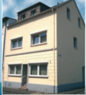
Haus Gertrud Bischof-Stradmann Str. 27