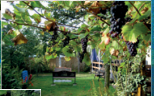
Garten der Entschleunigung