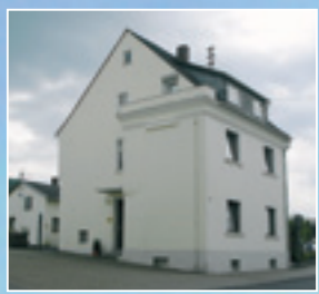
Haus Sophie Sprudelstr. 12

Zentrale Citylage von Bad Hönningen zwischen Bonn und Koblenz