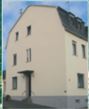
Haus Petra Sprudelstr. 16