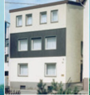
Haus Magarethe Sprudelstr. 22